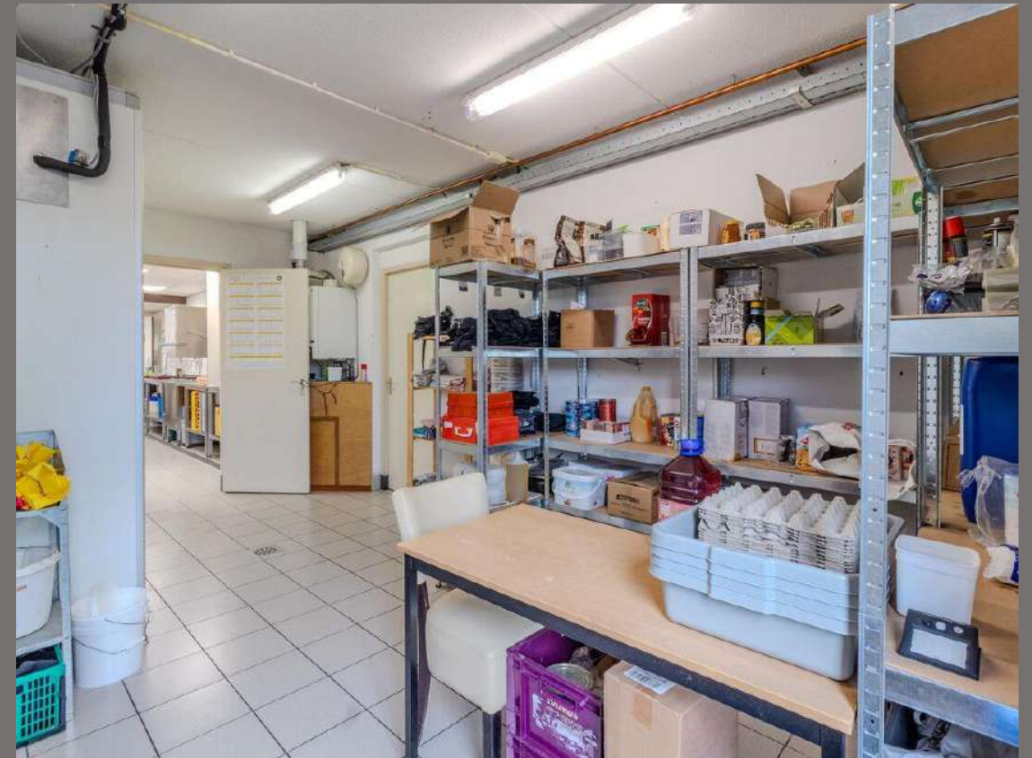
Details keuken en opslag