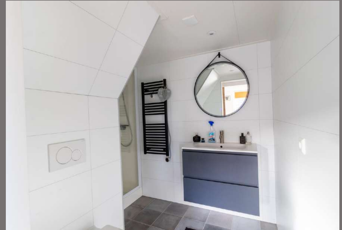
Slaapkamer met badkamer