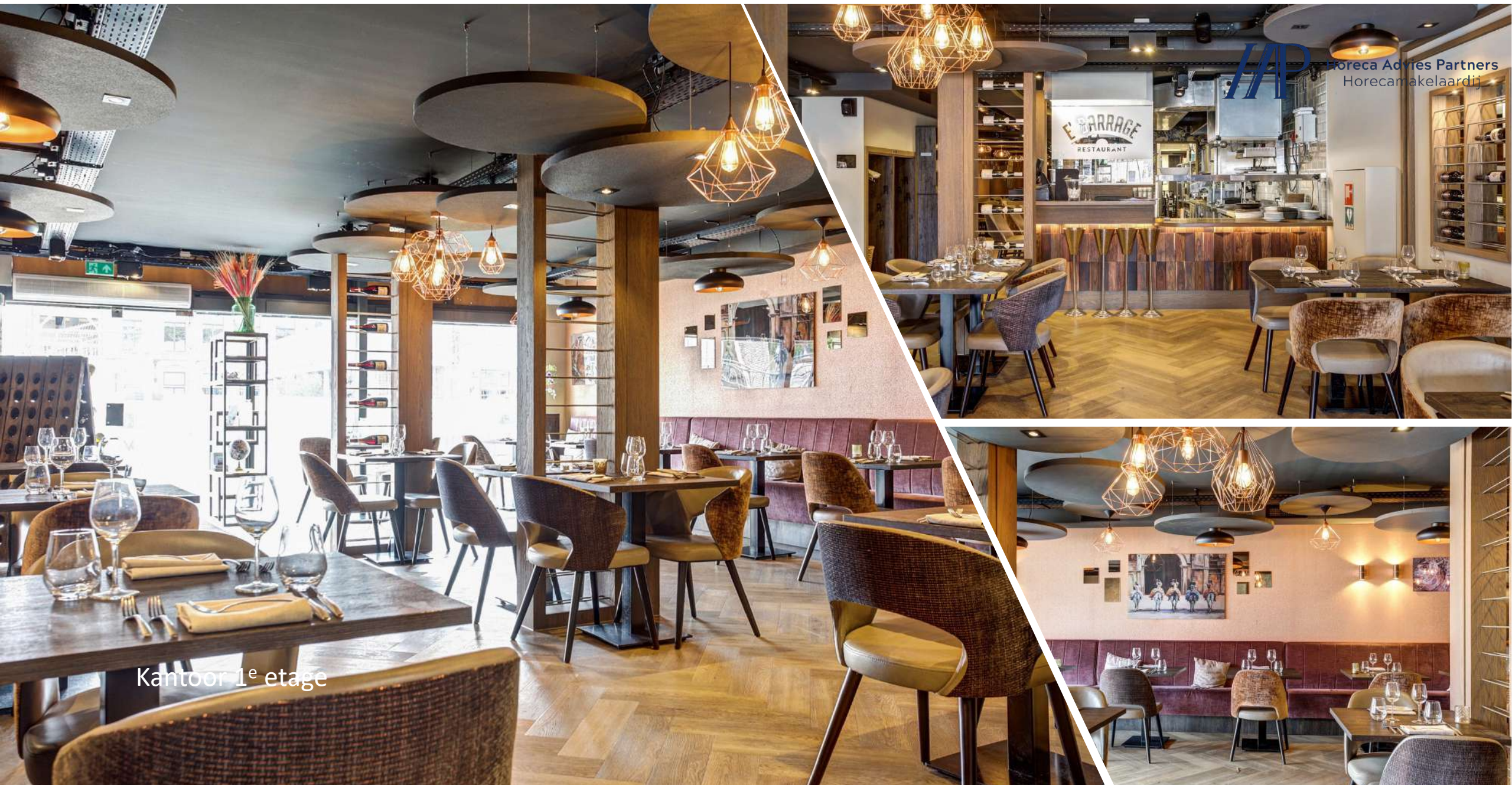
Kantoor 1 e etage